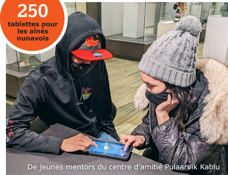
De jeunes mentors du centre d'amitié Pulaarvik Kablu